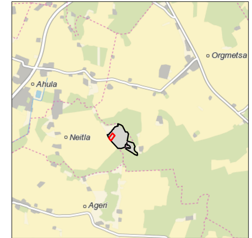
Kaardilehed nr 6342 Aegviidu, 6431 Tapa